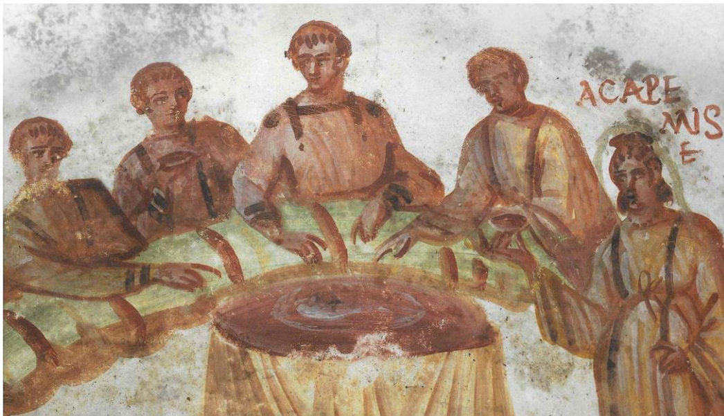
Christliches Bankett, Katakombe S. Marcellino e Pietro (Rom)

Heiligenfeste bei den Kopten konnten jedoch auch schnell außer Kontrolle geraten: Trunkenheit, Magie, pagane Praktiken und Ausschweifungen aller Art veranlassten Kleriker dazu, in ihren Predigten gegen allzu ausgelassenes Festtreiben vorzugehen. Wie und mit welchem Erfolg versucht wurde, auch wegen Festen einen christlichen „Knigge“ in der ägyptischen Bevölkerung zu etablieren, steht im Mittelpunkt des zweiten Teils des Vortrags.